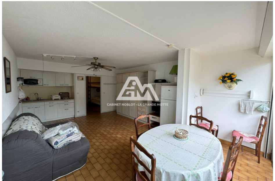
Studio cabine 6731 La Grande-Motte

Emission de gaz à effet de serre (ges) : B